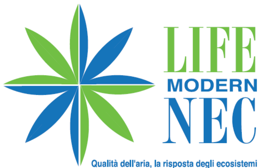
Logo progetto in formato orizzontale

Il logo è strutturato da 4 elementi uguali e speculari e la sua costruzione grafica circolare evoca un fiore, un mulino a vento, una girandola ad aria, una bussola per orientarsi. Disegnato nei colori azzurro e verde si associa immediatamente agli elementi naturali quali, acqua, foreste, aria. La costruzione grafica del logo, i due colori istituzionali, le due tipologie di lettering ed il pay off sono parte integrante dell'immagine coordinata da applicare a tutti gli strumenti di comunicazione siano essi cartacei, tridimensionali o virtuali. Il corretto utilizzo dell'immagine coordinata garantisce l'immediata riconoscibilità del progetto.